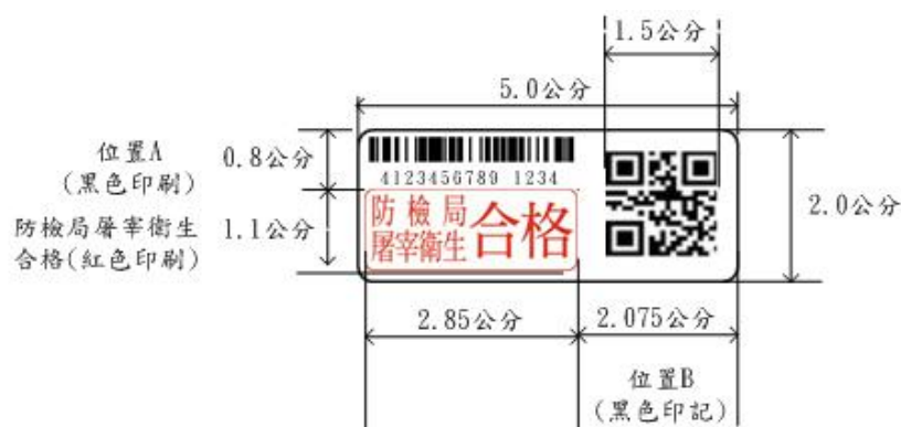
丙式屠宰衛生檢查合格標誌